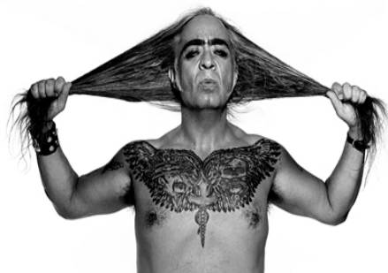
Gómez Peña en sus múltiples personajes